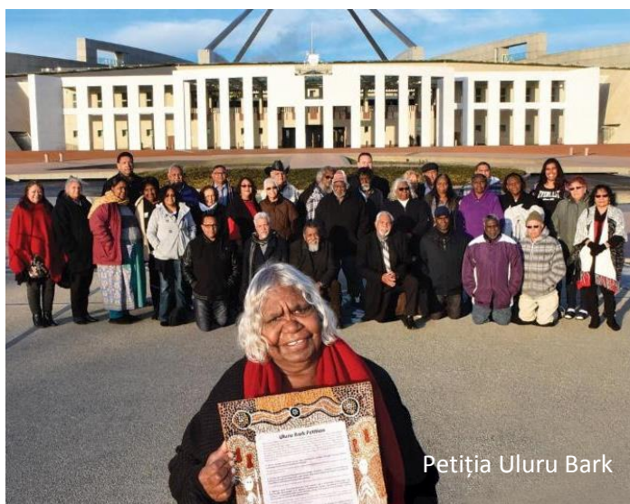
Petiția Uluru Bark

Dumnezeu a răspuns rugăciunilor noastre. A Lui să fie toată mulțumirea și slava.