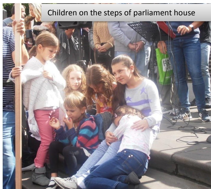
Children on the steps of parliament house