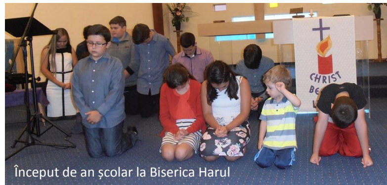
Început de an școlar la Biserica Harul