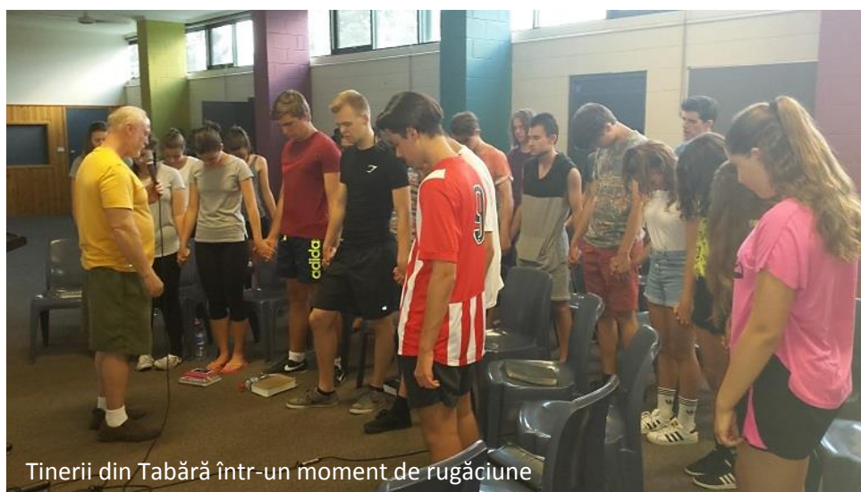
Tinerii din Tabără într-un moment de rugăciune