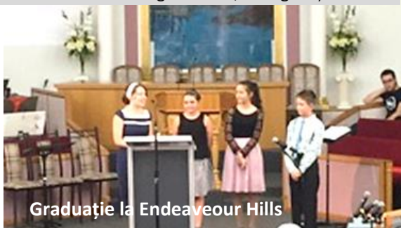
Graduație la Endeavour Hills