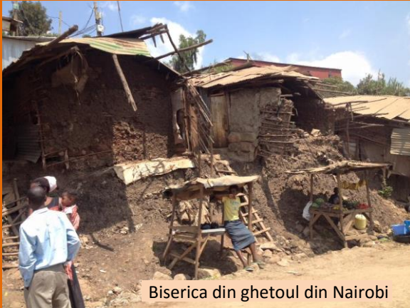
Biserica din ghetoul din Nairobi

Prin sărăcia extremă în care ne aflăm aici în Africa, ne bucurăm enorm de cât de binecuvântați suntem. Mulțumim Domnului că putem să ne implicăm și să împărțim dragostea lui Dumnezeu prin Evanghelia acestor oameni foarte greu încercați, dar și prin ajutorare, datorită diferitelor proiecte sociale pe care le desfășurăm printre africani. Lăudat să fie Domnul!