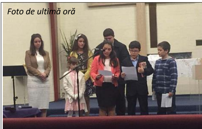
Foto de ultimă oră

Ziua taților. Copiii din Biserica Harul au avut un program de laudă și închinare adus Tatălui din Ceruri, Cel care a creat toate lucrurile și, de asemenea, taților pământești, pentru care au respect, recunoștință și ascultare. Dumnezeu să binecuvânteze pe copii, pe tați și Bisericile în care ne-a așezat.