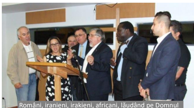
Români, iranieni, irakieni, africani, lăudând pe Domnul