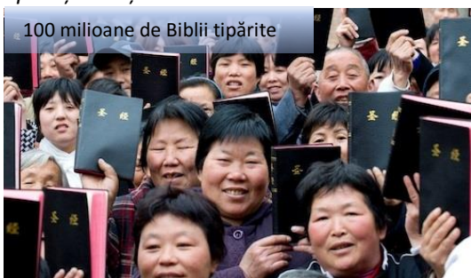
100 milioane de Biblii tipărite

În ciuda anilor de opresiune, adesea sălbatică, Biserica din China este în creștere frenetică. Yu Jie, un scriitor și disident din China, scrie în numărul din august al revistei First Things , că, începând din 1949, când comuniștii au preluat puterea și misionari creștini au fost expulzați, numărul creștinilor din China s-a multiplicat de la o jumătate de milion la mai mult de 60 de milioane de astăzi. În cazul în care ratele actuale de creștere continuă, „până în 2030, creștinii din China vor depăși 200 de milioane, ceea ce face China, țara cu cea mai mare populație creștină din lume”.