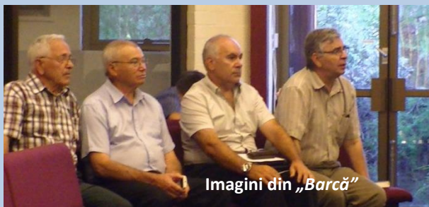
Imagini din „Barcă”

Fiecare dintre noi avem limitele noastre. Petru merge pe ape, dar merge puțin, căci a văzut pericolul și s-a îndoit. Dragii mei, să nu ne așteptăm la perfecțiune, suntem limitați, suntem oameni pe pământul acesta. În orice împrejurare, privește la Isus! Umblarea lui Petru pe ape ne dovedește suficiența lui Isus. Ajutorul, salvarea vine de la Domnul, care ne așteaptă să-l cerem ajutorul. Și de ce să nu strigăm la Domnul? Avem și o altă soluție? Trebuie să știm cu toții, și să spunem și altora, că Domnul Isus este