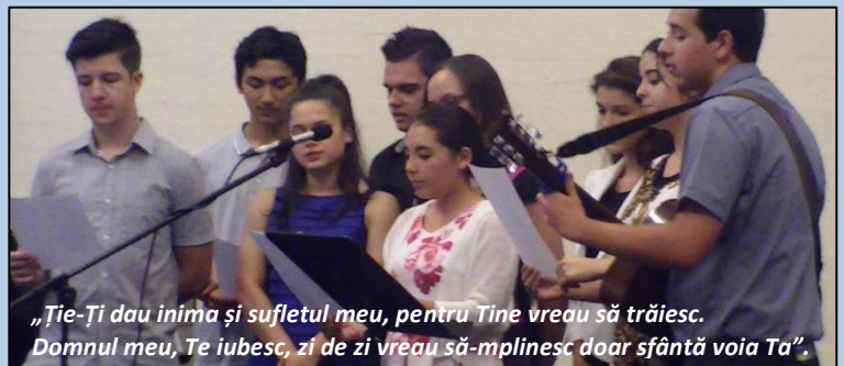
„Ție-Ți dau inima și sufletul meu, pentru Tine vreau să trăiesc. Domnul meu, Te iubesc, zi de zi vreau să-mplinesc doar sfântă voia Ta”.

Umblarea lui Petru pe apă este motivată de credință. Atâta timp cât nu s-a îndoit, el a stat deasupra apelor. Și noi putem pluti deasupra furtunilor acestei vieți, putem pluti deasupra valurilor, dar o putem face numai prin credință. Când vom putea să mergem prin credința noastră fără a privi în stânga sau în dreapta, vom ieși biruitori. Doamne, mărește-ne credința.