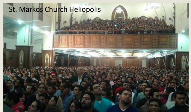
St. Markos Church Heliopolis