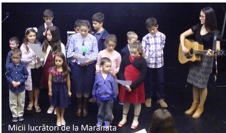
Micii lucrători de la Maranata

Dumnezeu să ne ajute să fim dintre aceia care îl așteptăm veghind și lucrând pentru slava Domnului.