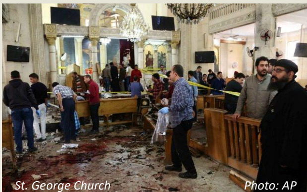
St. George Church