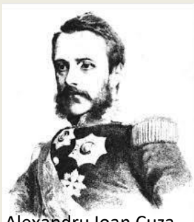
Alexandru Ioan Cuza

Leul devine oficial monedă a românilor pe 16 septembrie 1835 când domnul Țării Românești, Alexandru Ghica, instituie ca monedă a țării, „ leu ”, unitate teoretică de cont, echivalentul a 60 de parale. Tranzacțiile, taxele, impozitele se calculau în lei, dar se plăteau în monedă străină. În Moldova, domnitorul Mihail Sturdza, ar fi dorit în 1835 să bată monedă, dar Imperiul Otoman, nu ar fi acceptat ca un stat vasal să aibă propria monedă, deoarece ar fi fost un semn al independenței.