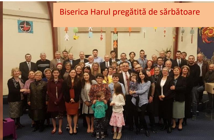
Biserica Harul pregătită de sărbătoare