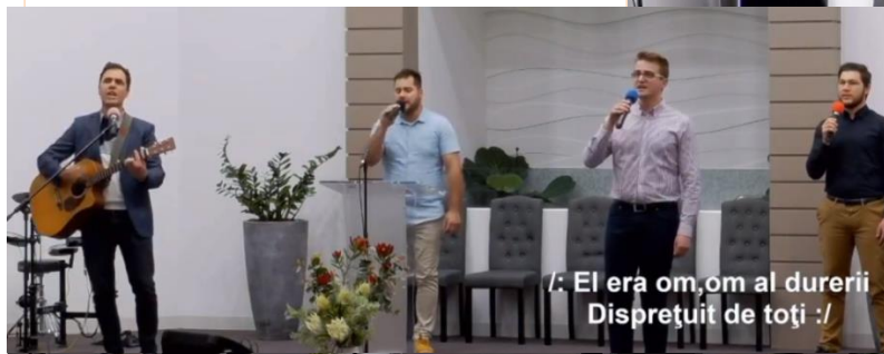
! El era om, om al durerii Disprețuit de toți !