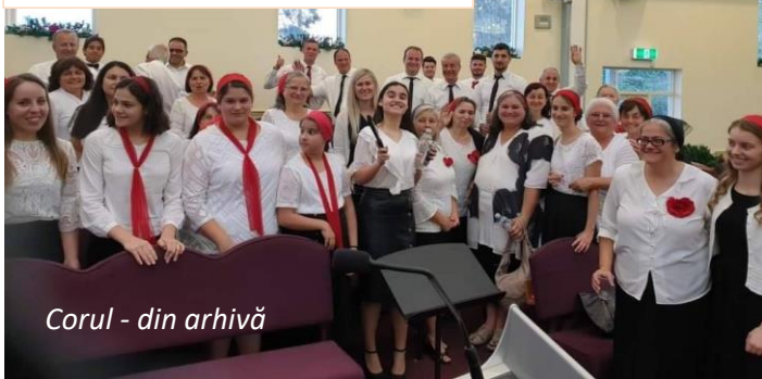
Corul - din arhivă