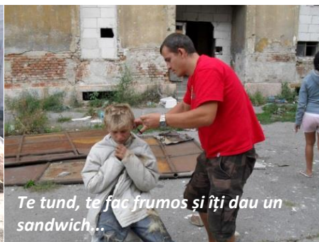
Te tund, te fac frumos și îți dau un sandwich...

Dumnezeu ne-a dat harul sa fim o mână întinsă spre multe suflete aflate în nevoie. Luna viitoare se împlinesc 18 ani de când am început Misiunea pe stradă, cu hrană caldă la cei fără adăpost.