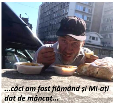
...căci am fost flămând și Mi-ați dat de mâncat...