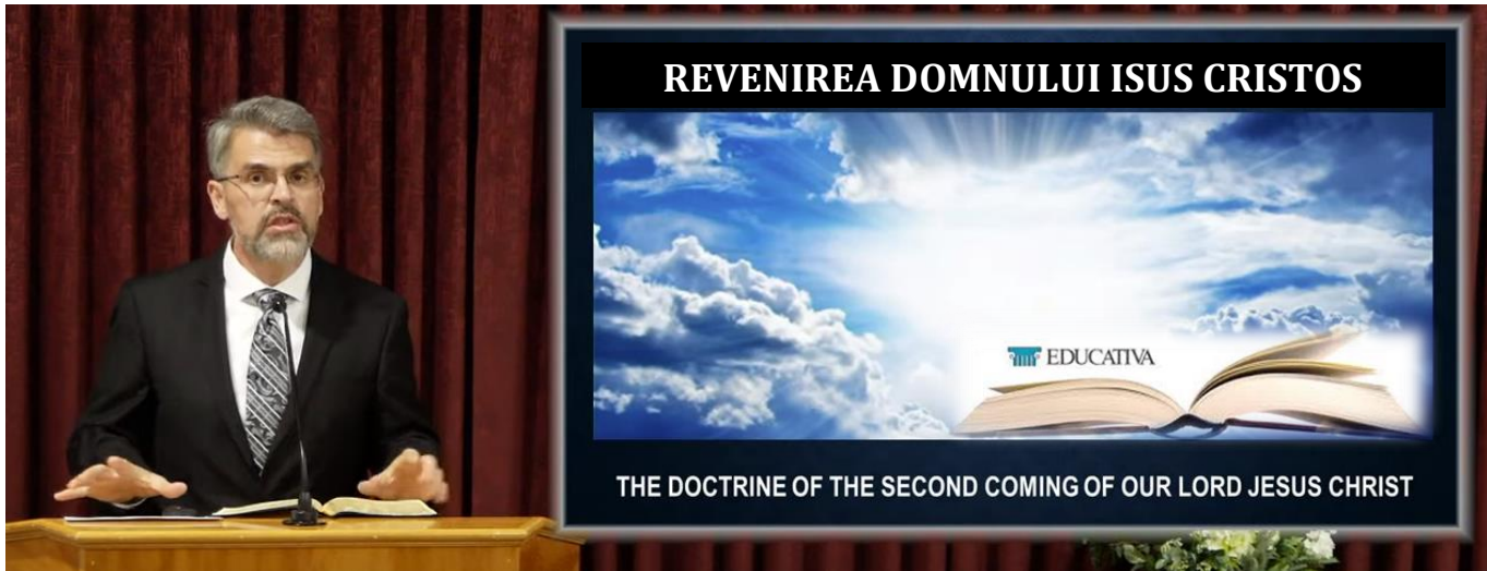
Păstor Teofil Ciortuz